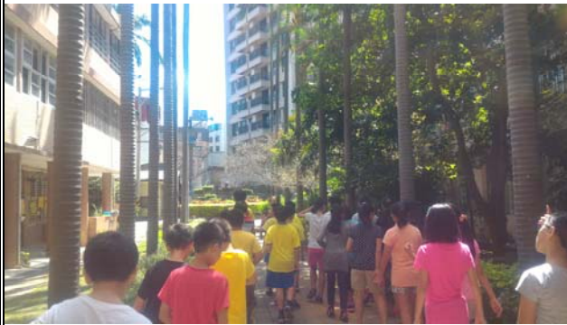
老師透過校園實地訪查校園植物分布