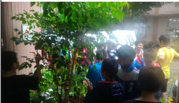
學生圍繞植物討論