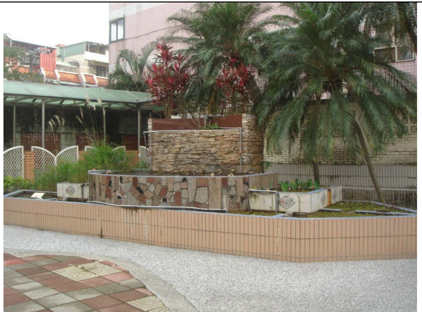
逆滲透廢水回收目前已無使用