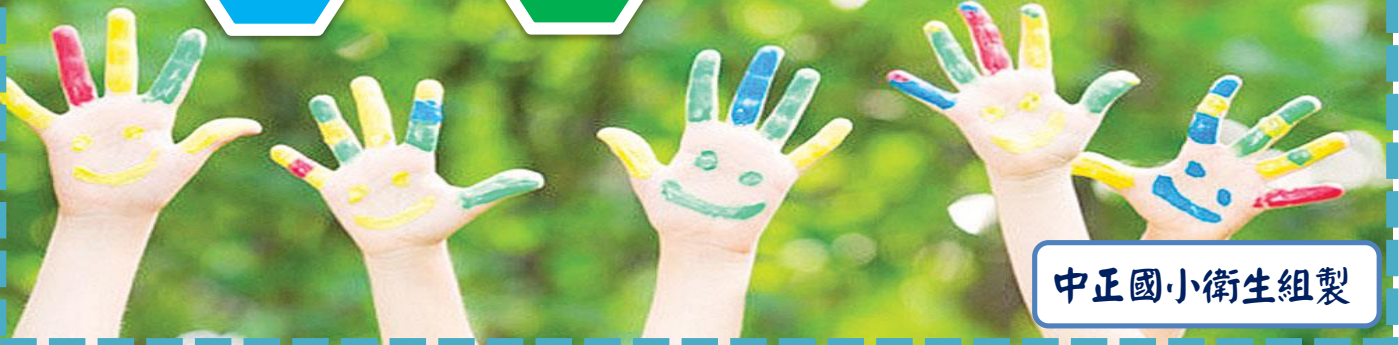
中正國小衛生組製